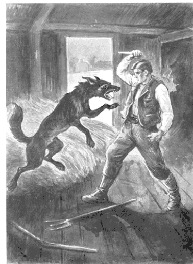
L'animal se dressa, et allongea comme pour le mordre, son museau pointu... Firmin frappa.