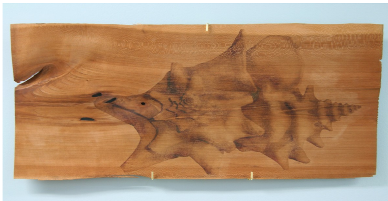
L'un des huit transferts d'image sur bois de merisier

Collection n° 4 [Extension][2010] ce sont huit transferts d'images sur bois de merisier selon une technique mise au point par l'artiste. Celle-ci a également laissé au musée un témoignage audio traçant son parcours artistique et sa démarche pour la réalisation des œuvres précitées et d'autres créations dont des photos sont présentées avec son récit. Des miniatures uniques, numérotées et signées par Jeanne de Petriconi sont vendues à la boutique du musée.